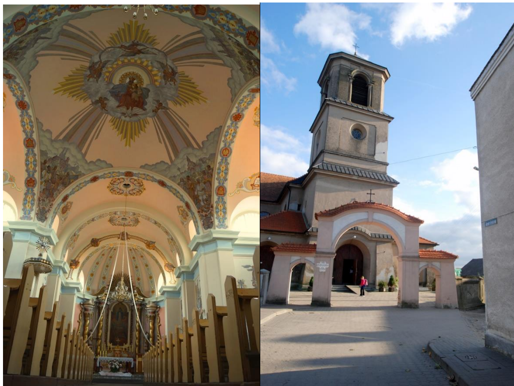
Fot. 13., 14 . Kościół pw. św. Mikołaja i NMP w Mroczu