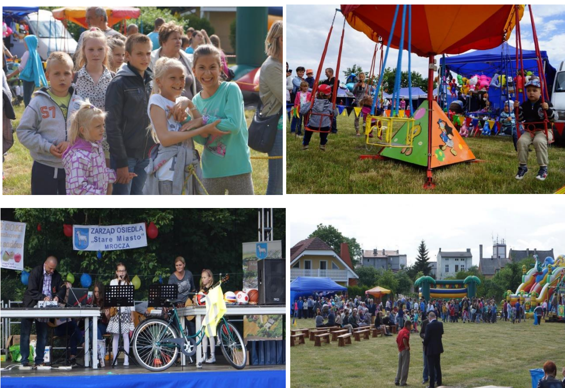
Fotografia 3, 4, 5, 6 Festyn rodzinny „Powitanie Lata”