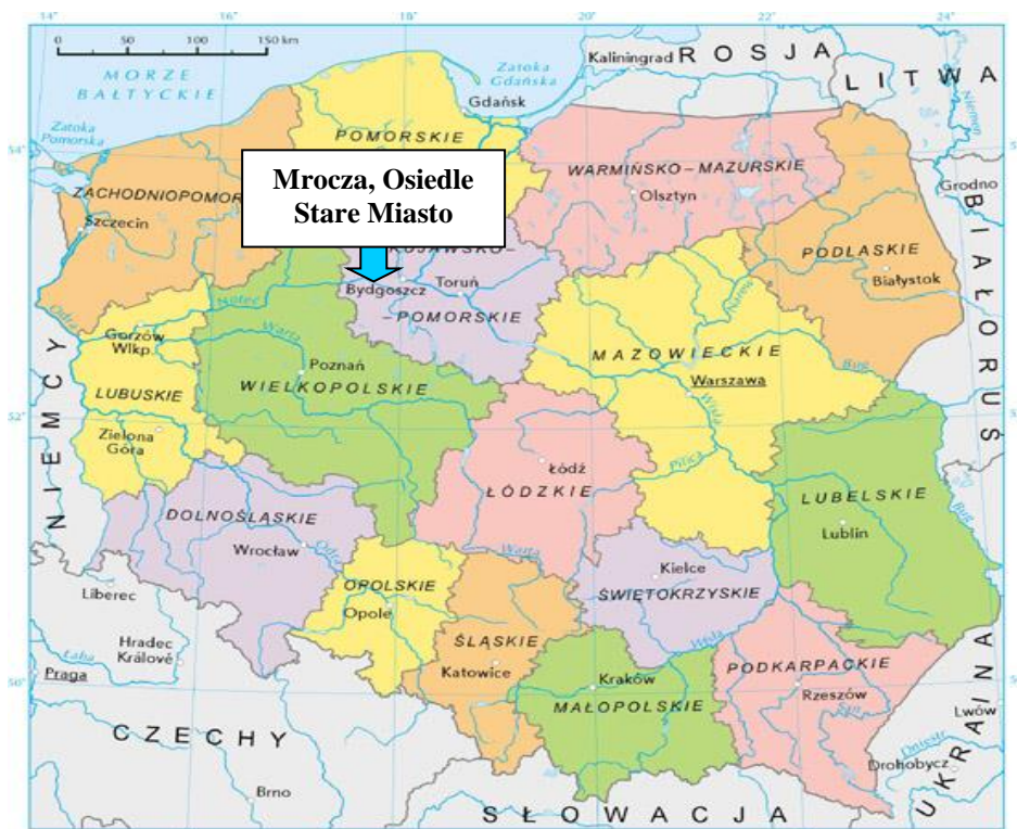
Mapa 1. Położenie Mroczy na tle kraju i województwa

5 Stycznia, Bocianowo, Bydgoska, Drzewianowska, Kościelna, Kościuszki, Kozia, Krótka, Leśna, Łąkowa, Ogrodowa, Plac 1 Maja, Poprzeczna, Śluzowa, Wodna, Zielona, Żabia.