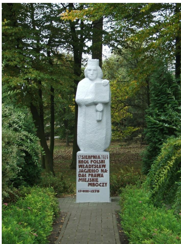
Fotografia 1. Pomnik króla Władysława Jagiełły

wydarzenia w Mroczy stanął pomnik króla, a park w którym się znalazł nazwany został imieniem władcy.