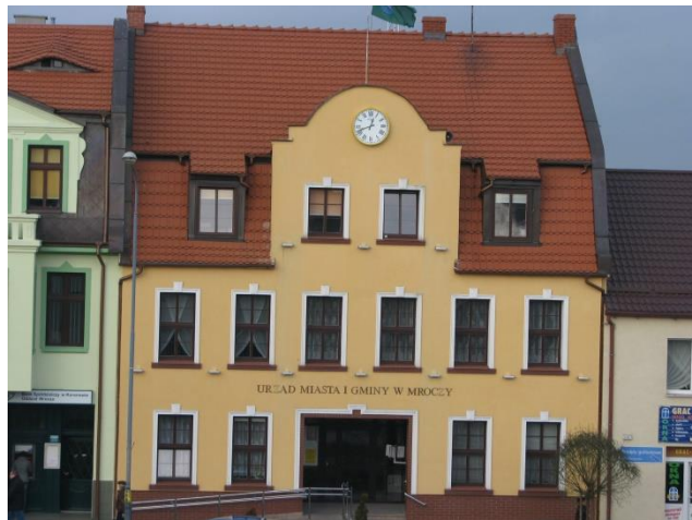
Fot. 11. Budynek Urzędu Miasta i Gminy w Mroczy