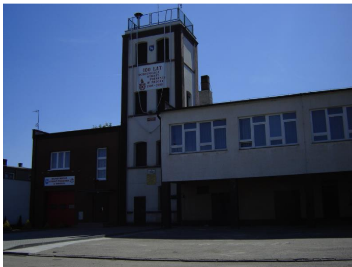
Fot. 12. Remiza OSP w Mroczy

Zabytkowy kościół parafialny pod wezwaniem św. Mikołaja postawiono w XIV wieku. Obecna świątynia została wybudowana w latach 1930-1932 w stylu barokowym według projektu architekta Soczkiewicza. Pracami budowlanymi kierował budowniczy Jarocki z Bydgoszczy. Jest to budowla murowana, neobarokowa o pięciu nawach. Wyposażenie wnętrza pochodzi z poprzednich świątyń, w większości reprezentuje styl barokowy. W 1939 świątynia została zamknięta przez hitlerowców, a księża otrzymali areszt domowy. Wskutek działań wojennych w latach 1939 - 1945 świątynia parafialna w znacznej części została zniszczona. W kolejnych latach parafianie odbudowali swój kościół. Po wojnie świątynia została gruntownie odnowiona i odbudowana. W 1955 roku zostało założone ogrzewanie w świątyni, natomiast rok później została położona nowa posadzka i zostało ustawione nowe pancerne tabernakulum. W 1963 roku kościół został uroczystie konsekrowany. Uroczystości przewodniczył ówczesny sufragan gnieźnieński ks. bp. Lucjan Bernacki. W 1971 roku w świątyni została zainstalowana nowa droga krzyżowa oraz tablice pamiątkowe dla budowniczych świątyni. W 1981 został poświęcony nowy krzyż misyjny. Na przestrzeni ostatnich lat renowacji poddane zostały malowidła ściennie w świątyni, wymieniono ogrzewanie oraz nagłośnienie oraz wykonano remont elewacji kościoła. Ponadto wyremontowano budynek plebanii oraz wikariatu.