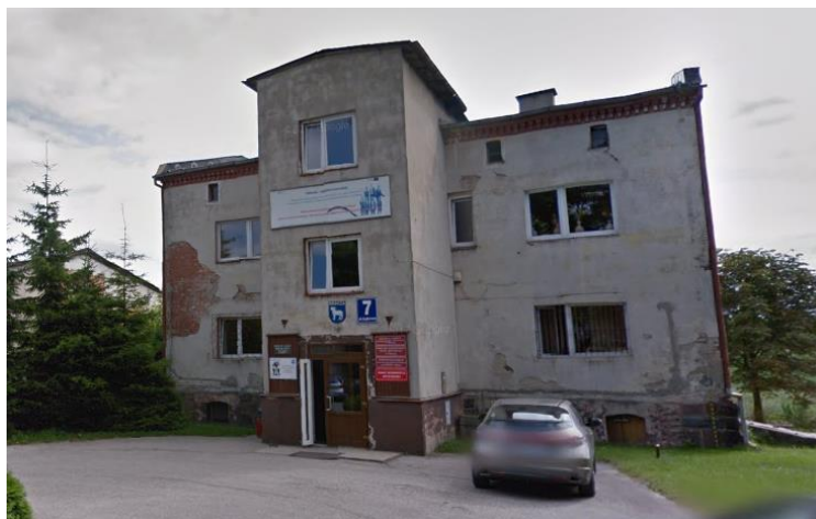
Fotografia 9. Budynek Miejsko-Gminnego Ośrodka Pomocy Społecznej