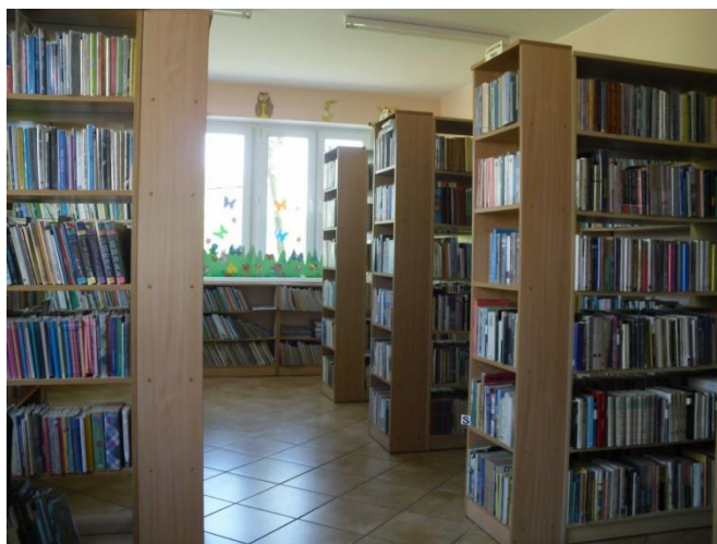
Fotografia 8. Pomieszczenia Miejsko-Gminnej Biblioteki Publicznej w Mroczy

czytelników w roku 1976 otwarto nowy lokal, w którym zlokalizowano bibliotekę dla dorosłych. Nowy lokal znajdował się przy Placu 1 Maja, a w starym pomieszczeniu utworzono filię dziecięcą. Lata 90-te przyniosły zmiany w strukturze bibliotek. Na mocy ustawy o Samorządach Terytorialnych obowiązek utrzymania i prowadzenia bibliotek spoczął na gminach w ramach zadań własnych. Skutkiem tego w 1991r. zamknięto filię dla dzieci. Część księgozbioru przekazano do bibliotek szkolnych, a część dołączono do biblioteki dla dorosłych. W 1992r. Miejsko-Gminną Bibliotekę Publiczną przeniesiono do pomieszczeń Ośrodka Kultury. Tym samym stała się ona częścią jego struktur organizacyjnych. Taki stan rzeczy miał miejsce do roku 2009, w którym ponownie rozdzielono placówki. Niestety za zmianami organizacyjnymi nie poszły zmiany lokalowe. Biblioteka nadal zajmuje pomieszczenia MGOKiR przy ul. Śluzowej 6, które pozostawiają wiele do życzenia. Z uwagi na poszerzenie oferty MGBP o organizację imprez o charakterze kulturalnym i edukacyjnym obecnie zajmowane pomieszczenia są ciasne i niedostosowane do aktualnych potrzeb.