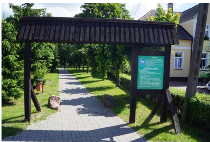
Fotografia 2. Wejście do Parku im. Władysława Jagiełły – Osiedle Stare Miasto Mrocza

Park to idealne miejsce do odpoczynku. Wymaga renowacji, która polegać ma na budowie ścieżki rowerowej łączącej centrum miasta z obwodnicą oraz jeziorem Hetmańskim, budowie miejsc aktywnego wypoczynku (Otwarte Strefy Aktywności- plac zabaw, siłownia zewnętrzna, strefa relaksu, itp.), toalety publicznej, ławek, oświetlenia, monitoringu, obiektów gastronomicznych, itp. Realizacja w/w przedsięwzięć pozwoli tak zagospodarować teren parku, aby stał się on atrakcyjnym miejscem spędzania czasu wolnego przez wszystkich mieszkańców (i nie tylko) w różnym wieku.