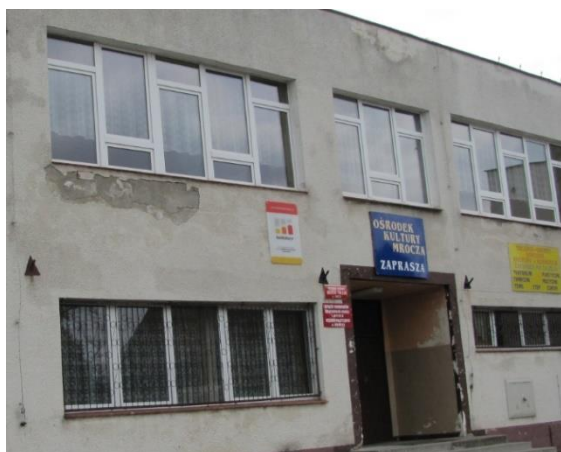
Fotografia 7. Budynek Miejsko-Gminnego Ośrodka Kultury i Rekreacji w Mroczy

Budynek Miejsko-Gminnego Ośrodka Kultury i Rekreacji w Mroczy zlokalizowany jest przy ul. Śluzowej 6 w Mroczy. Pomieszczenia MGOKiR stanowią część budynku w którym znajduje się również Biblioteka Publiczna oraz Remiza Ochotniczej Straży Pożarnej. W budynku przy ulicy Śluzowej działają różnego rodzaju sekcje: muzyczna, plastyczna, teatralna, szachowa i taneczna. Swoją działalność realizuje Teatr Bajzel, zespół Big Band, Zespół muzyczny uczniów Szkoły Podstawowej oraz Gimnazjum, zespół folklorystyczny „Mroczańki”. W obiekcie odbywają się zajęcia nauki gry na gitarze, płaskorzeźby, animacyjne i plastyczne. Ponadto odbywają się imprezy okolicznościowe oraz spotkania Klubu Seniora, Koła Kombatantów oraz Koła Gospodyń Wiejskich w Mroczy. Na chwilę obecną obiekt wymaga przebudowy oraz dostosowania do istniejących potrzeb m.in.: w dostosowaniu do użytkowania przez osoby niepełnosprawne, remont dużej sali (parkiet, nagłośnienie, oświetlenie, wentylacja i klimatyzacja), wyodrębnienie pomieszczeń pełniących funkcję pracowni, wyodrębnienie i wyposażenie kuchni, szatni, toalet, itp.