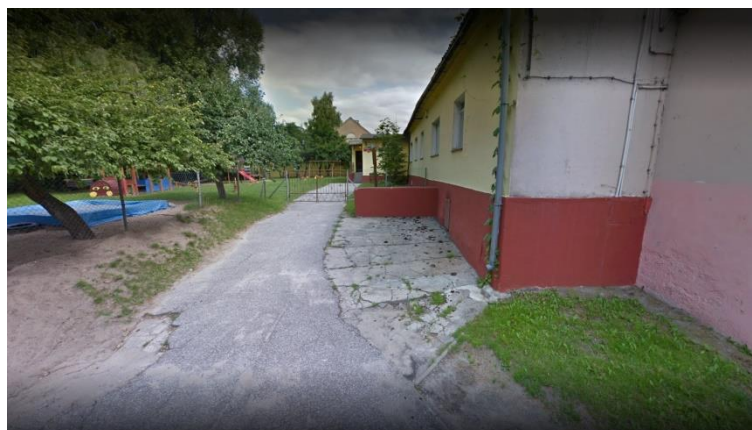
Fotografia 10. Budynek Przedszkola Miejskiego

Z uwagi na zły stan techniczny pomieszczeń, niedostosowanie do potrzeb oraz zbyt duże nakłady finansowe na wyremontowanie oraz dostosowania obiektu do obowiązujących norm opracowano dokumentację techniczną na budowę nowego budynku Przedszkola Miejskiego, które ma być zlokalizowany przy kompleksie budynków Szkoły Podstawowej w Mrocz.